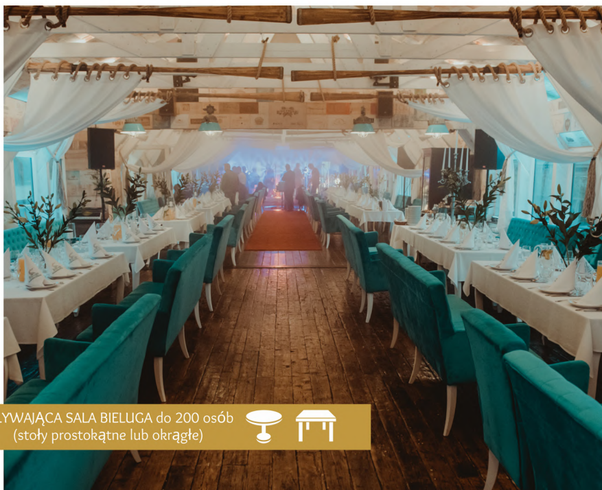
PŁYWAJĄCA SALA BIELUGA do 200 osób (stoły prostokątne lub okrągłe)