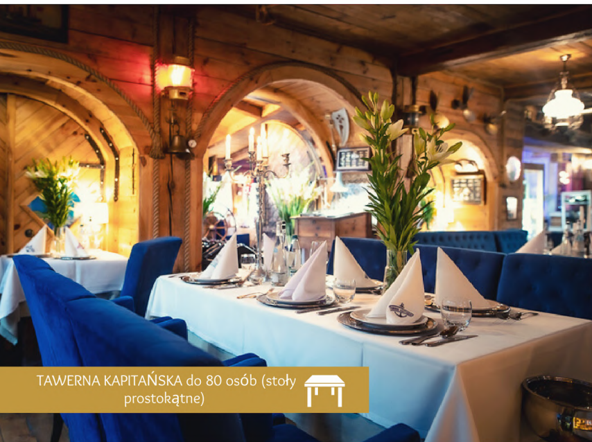
TAWERNA KAPITAŃSKA do 80 osób (stoły prostokątne)